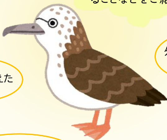
オオミズナギドリ (京都府の鳥)